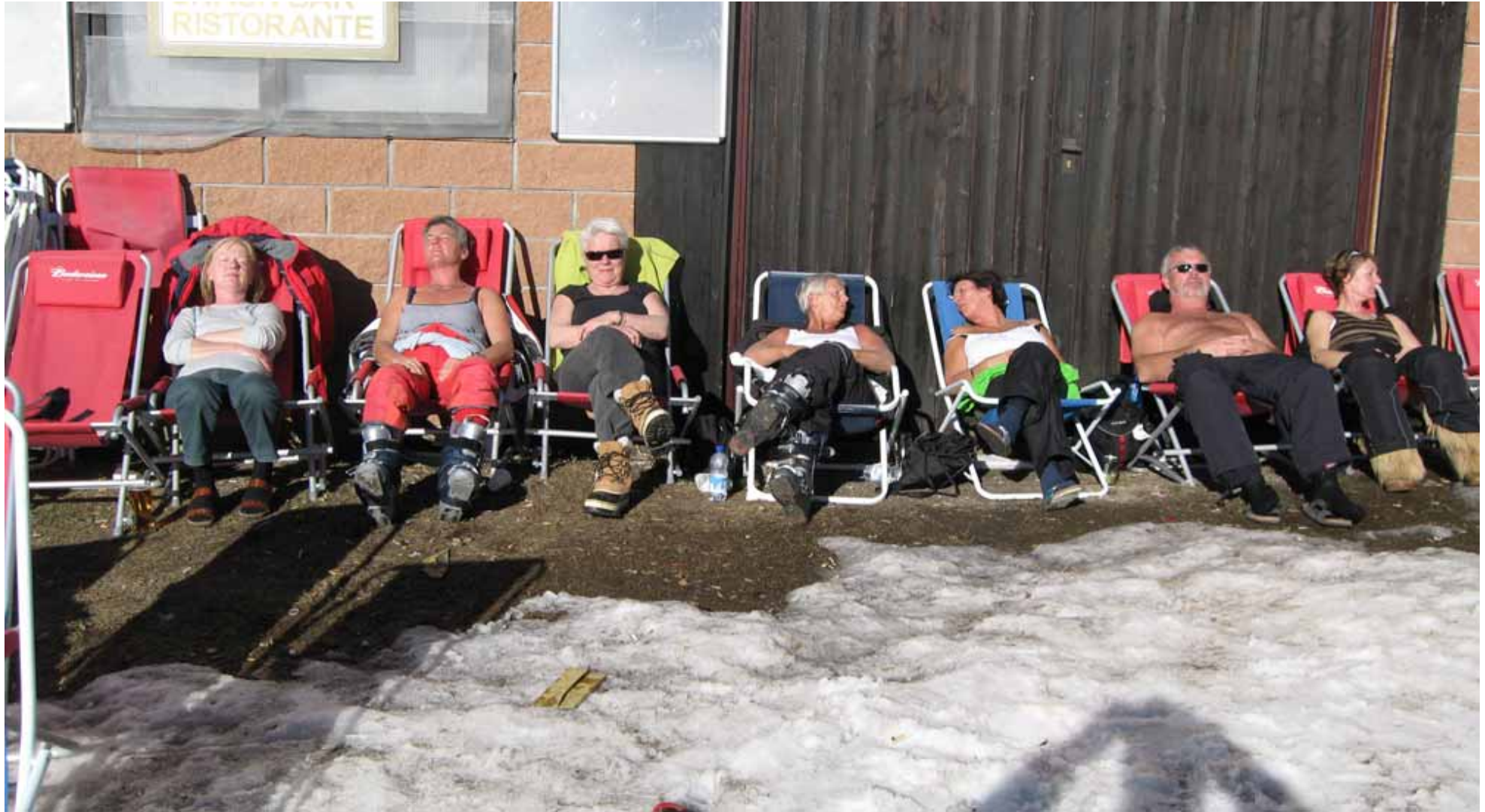
SIDE 17 • BINDINGEN